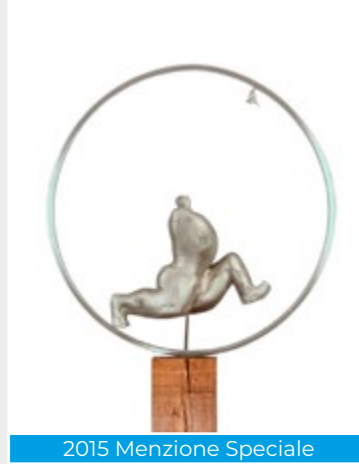
2015 Menzione Speciale

Nasce a Sassocorvaro (PS) nel 1951. Diplomatosi presso l'Istituto d'Arte di Pesaro (Sezione Ceramica), frequenta l'Accademia di Belle Arti prima a Roma, poi a Milano dove consegue il Diploma in Scultura. Vive e lavora in Montefiore Conca (RN), piccolo centro storico posto sulla collina della riviera romagnola, dove ha il suo atelier di scultura munito di fonderia artistica. Dal 1999 con il gruppo 'Montemaggiore Arte' ha l'obiettivo di realizzare un Museo di sculture all'Aperto denominato "M.I.S.A.M." posto sulla collina del Monte Maggiore.