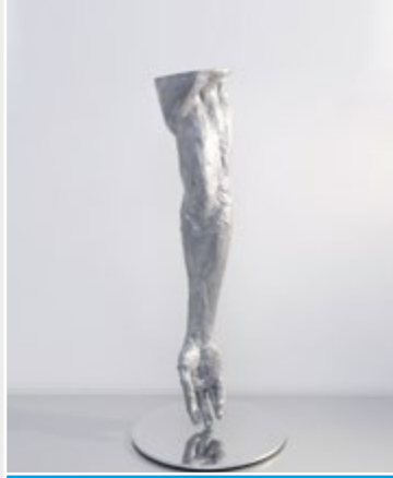
2017 Menzione speciale

Nasce a Matera nel 1966. Risiede a Bernalda (MT) e qui lavora in un'azienda che si occupa di estrusione di leghe di alluminio. Artista-artigiano, ex carrozziere con una lunga esperienza di metalli, da diversi anni si occupa di lavorazione dell'alluminio. Crea oggetti di arredamento e quadri con pezzi di scarto. Iniziò dopo aver preso possesso di un blocco di alluminio scartato in azienda, trasformandolo in un crocefisso alto due metri. Ha esposto in diverse città italiane e in Spagna. Considera l'esperienza artistica essenzialmente come avventura della mente e ricerca dell'armonia.