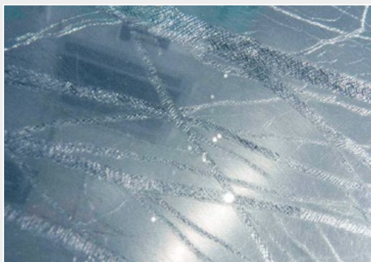
PREMIO COMEL 2012 'TRA CUORE E RAGIONE' Vincitore: Massimiliano Drisaldi (Italia) - Inverno (particolare)