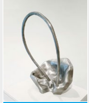
2018 Menzione Speciale

Nasce a Belgrado nel 1971. Figlio d'arte (suo padre è lo scultore accademico Aleksandar Kuzmanovich), ha frequentato la scuola d'arte specializzandosi nella lavorazione di metalli preziosi e frequentando il workshop dell'orafo Zlatko Marijanović. Si è laureato in Scultura applicata presso l'Università di Arti applicate di Belgrado. Nel 2000 è entrato a far parte dell'associazione artistica ULUPUDUS. Oltre alla realizzazione di props teatrali e cinematografici, ha sviluppato una personale arte poetica attraverso la scultura e l'installazione. Recentemente si è interessato alla grafica.